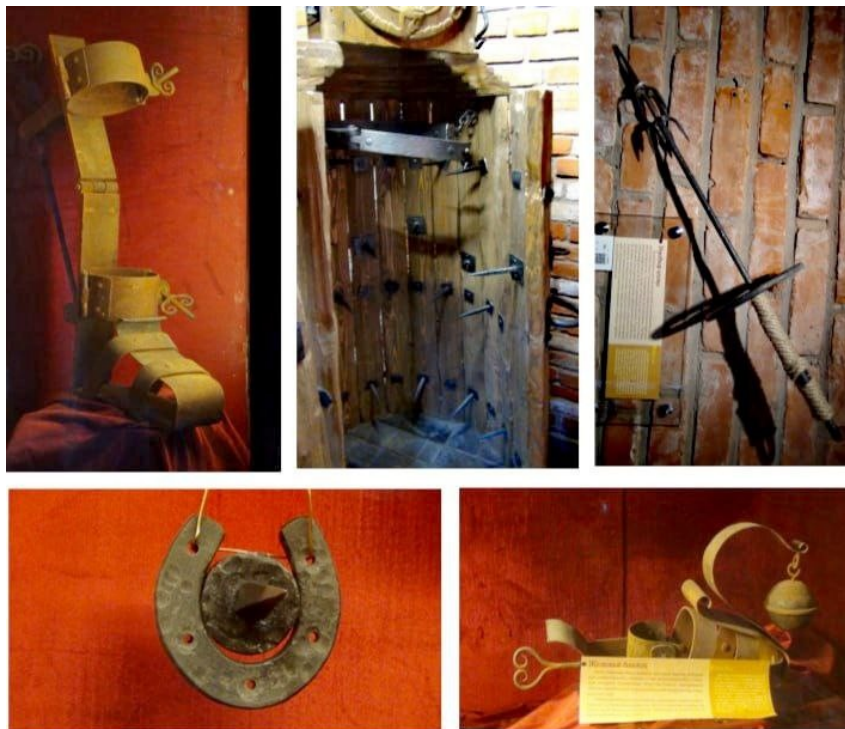
Рисунок 2. Некоторые инквизиционные приспособления средневековой Восточной Пруссии для повреждения (сдавливания) тела и вытягивания внутренностей. Внизу слева - «Печать конокрада» для вбивания металла в пятки (Музей средневековых пыток...). Фото авторов (2020)