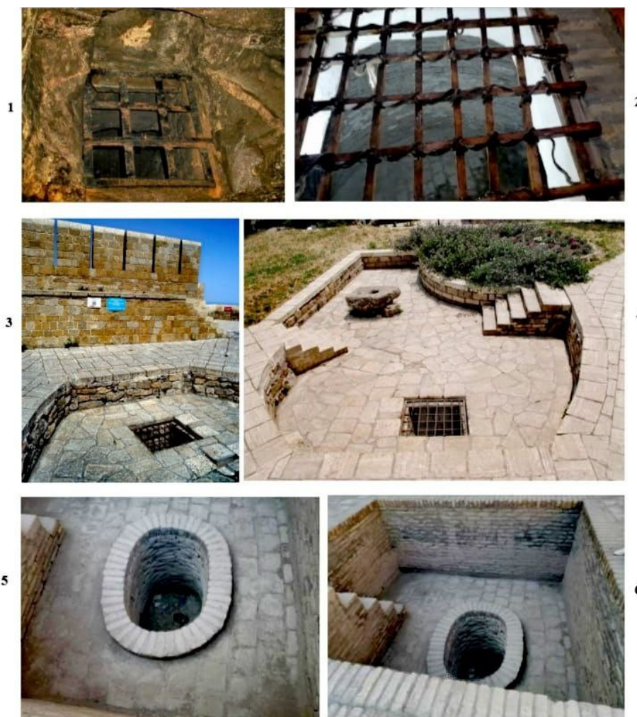
Рисунок 1. Тюрьмы-«колодцы»: