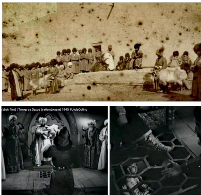
Рисунок 4. Зинданы у ног хана.

«Железные кольца, на которой крепится цепь, вделывать в стене близ самого пола, дабы цепи, идущие от них, не тяготили собою преступников. К сим кольцам прикреплять цепь длиной в три аршина, звенья цепи должны быть такой же толщины, как в ножных кандалах, а обруч, налагаемый на преступника, обшит кожей» (ГБУТО ГА в г. Тобольске, 1843, л. 75).