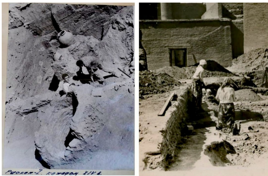
Рисунок 3. Археологические раскопки зиндана в 1987, г. Хива, Ичан-Кала (Архив Государственного музея..., Кп. 6185/1). Слева: колодец в культурном слое XIV в. с полукруглым обрамлением. Справа: стенка XIX в. от зиндана, построенная выше уровня земли. Обрамление колодца и стенка не сохранились

Однако на фотографии, сделанной во время археологических раскопок 1987 г. (рис. 3), видно, что объект имел обрамление (стенку) высотой примерно 1 м, что характерно для обычного колодца с водой. Следовательно, при его перестройке в зиндан глубина, воспринимавшаяся арестантом изнутри, составляла не 1,82 м, а около 3 м. Колодец также имел нестандартную форму: не круглую или квадратную, как обычно, а овальную, что является крайней редкостью.