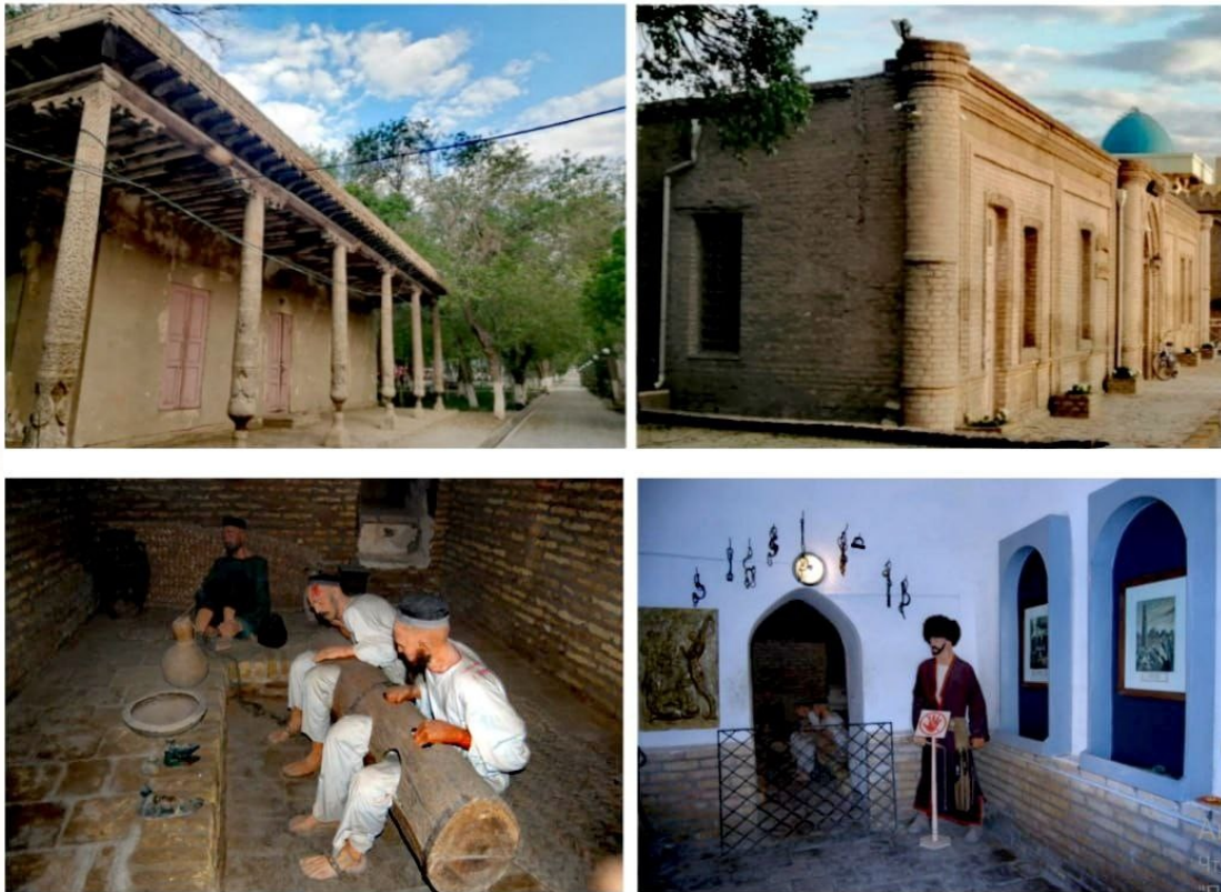
Рисунок 5. Пенитенциарные учреждения Хивы. Верхний ряд: две тюрьмы, построенные при Асфандияр-хане (1910–1918 гг.). Слева: здание для предварительного заключения и службы охраны дворца. Справа: городская тюрьма для содержания преступников. Фото авторов, 2025 г. Нижний ряд: экспозиция «Правосудие ханского периода», созданная в 1970 г. в бывшем зиндане комплекса Куня-Арк (фотография из личного архива Д. К. Бабажонова, г. Хива).

с тем англичане сами использовали карательные практики местного происхождения. Одно из наиболее известных наказаний сохранялось даже во второй половине XIX в. под названием «дьявольский ветер»: осужденных привязывали к дулам пушек и стреляли залпом, в результате чего тела разрывались на части (Крашенинникова & Трикоз, 2018, с. 34). Англо-саксонская правовая система ориентировалась не столько на закон, сколько на прецедент, который позволял при управлении завоеванными территориями в каждой из них создавать собственные правила.